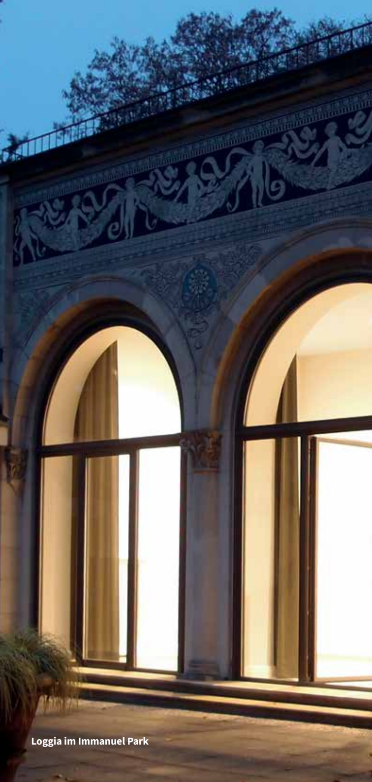
Loggia im Immanuel Park